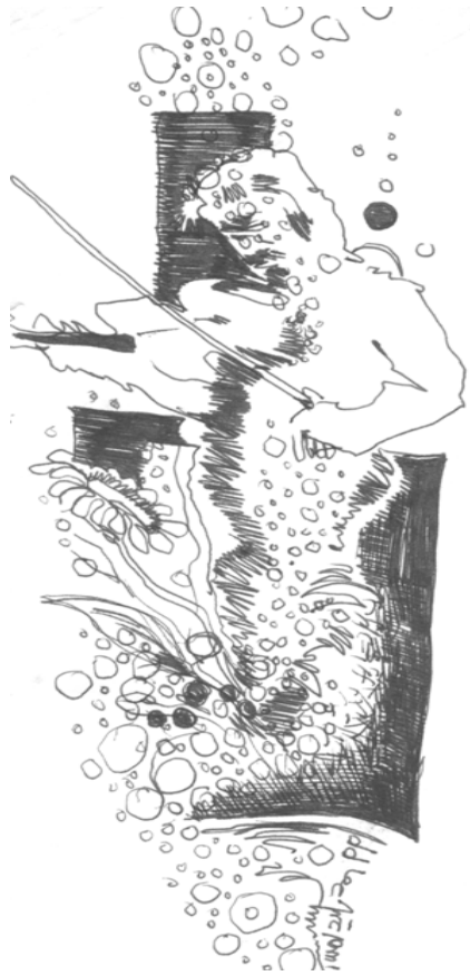
(بچوكترين زیندووی من)